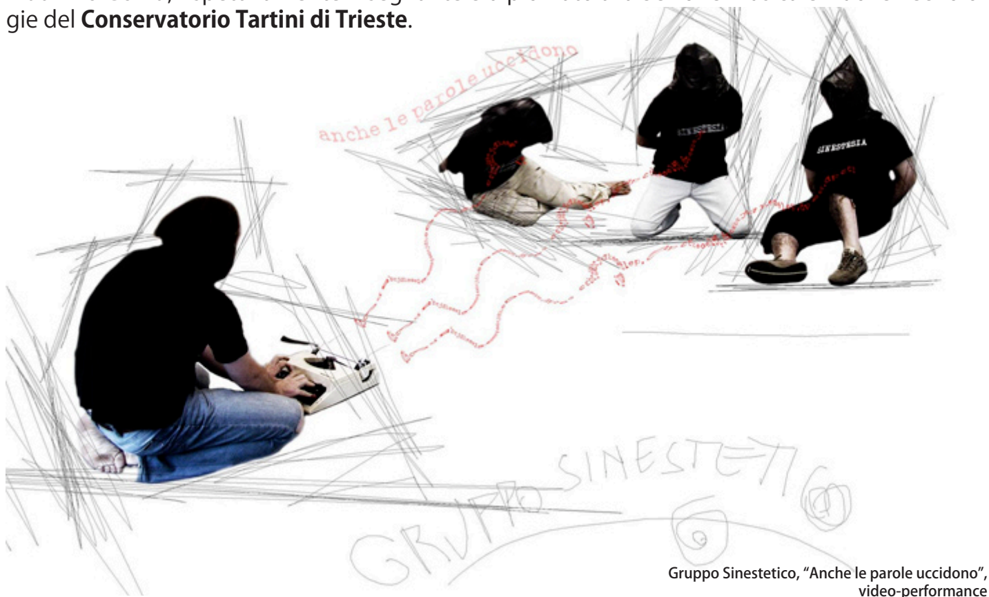
Gruppo Sinestetico, "Anche le parole uccidono", video-performance